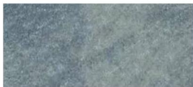
wapień dewoński antic®