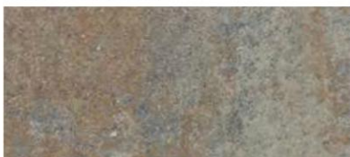
wapień muszlowy antic®